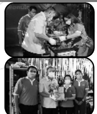
โรงไฟฟ้าบีแอลซีพี ออกกฐินนิทานการในงานวันสมเด็จพระเจ้าตากสินมหาราช และงานกาชาด จังหวัดระยอง ประจำปี 2565 สนับสนุนการปลูกผักปลอดสารพิษแบบเกษตรอินทรีย์วิถีพอเพียง ที่ปลูกจากดินผสมมูลไส้เดือน ซึ่งมีการนำมาปลูกผักเพื่อรับประทานภายในโรงไฟฟ้าบีแอลซีพี และขยายองค์ความรู้ไปยังชุมชนเพื่อยกระดับคุณภาพชีวิตและส่งเสริมการค้าทางเศรษฐกิจอย่างยั่งยืน ณ สนามกีฬาเทศบาลเมืองระยอง