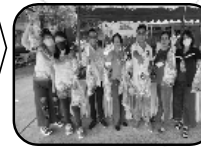
2. โรงไฟฟ้าบีแอลซีพี ร่วมกับชุมชนในเขตเทศบาลเมืองมาบตาพุด ดำเนินโครงการ "เพาะพืชผักปลอดสารพิษ" มีผู้เข้าร่วมกิจกรรม จำนวน 39 ครัวเรือน