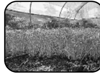
1. โรงไฟฟ้าบีแอลซีพีร่วมกับชุมชนในเขตเทศบาลเมืองมาบตาพุด ดำเนินโครงการ "ปลูกผักปลอดสารพิษ" โดยได้รับสนับสนุนจากสำนักงานสาธารณสุขเมืองมาบตาพุด จำนวน 39 ครัวเรือน

โรงไฟฟ้าบีแอลซีพีร่วมกับชุมชนในเขตเทศบาลเมืองมาบตาพุด และสำนักงานสาธารณสุขและสิ่งแวดล้อม เทศบาลเมืองมาบตาพุด คัดเลือกโครงการเกษตรอินทรีย์ วิถีพอเพียง จากสารพัดชุมชนเกษตรอินทรีย์วิถีพอเพียงในอำเภอมาบตาพุด มาเป็นโครงการนำร่องในโรงไฟฟ้าฯ ปัจจุบันได้ถ่ายทอดองค์ความรู้เกษตรอินทรีย์ในพื้นที่เทศบาลเมืองมาบตาพุด ได้แก่ โครงการปลูกผักปลอดสารพิษ, โครงการเพาะพืชผักปลอดสารพิษ, โครงการปลูกปาล์ม เป็นต้น