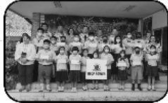
3. มอบทุนการศึกษา ประจำปี 2566 จำนวน 38 ทุนเรียนในเขตเทศบาลเมืองมาบตาพุด (ต่อเนื่องเป็นปีที่ 22)