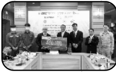
2. มอบทุนการศึกษาร่วมมือและมอบเงินสนับสนุนโครงการพัฒนาช่างเทคนิคช่างไฟฟ้าควบคุม (V-E-FC) วิทยาลัยเทคนิคมาบตาพุด (ต่อเนื่องเป็นปีที่ 4)