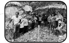
3. โรงไฟฟ้าบีแอลซีพี ร่วมกับสำนักงานสาธารณสุขและสิ่งแวดล้อม เทศบาลเมืองมาบตาพุด, 9 ชุมชน ในโครงการนำร่องเกษตรอินทรีย์วิถีพอเพียงในพื้นที่เทศบาลเมืองมาบตาพุด ดำเนินโครงการ "โครงการปลูกปาล์ม"