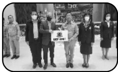
1. มอบทุนการศึกษาบุตรหลานบุคลากรผู้ถือกรรมสิทธิ์และสมาชิกของชุมชนในพื้นที่จังหวัดระยอง

โรงไฟฟ้าบีแอลซีพีให้ความสำคัญในการส่งเสริมการศึกษาเยาวชนในจังหวัดระยอง ด้วยการมอบทุนการศึกษาผ่านหน่วยงานภาครัฐ, สถาบันการศึกษา และชุมชนในพื้นที่